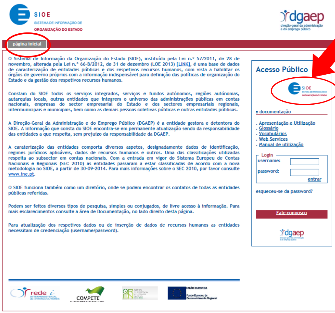
Figura 1 - Página Inicial