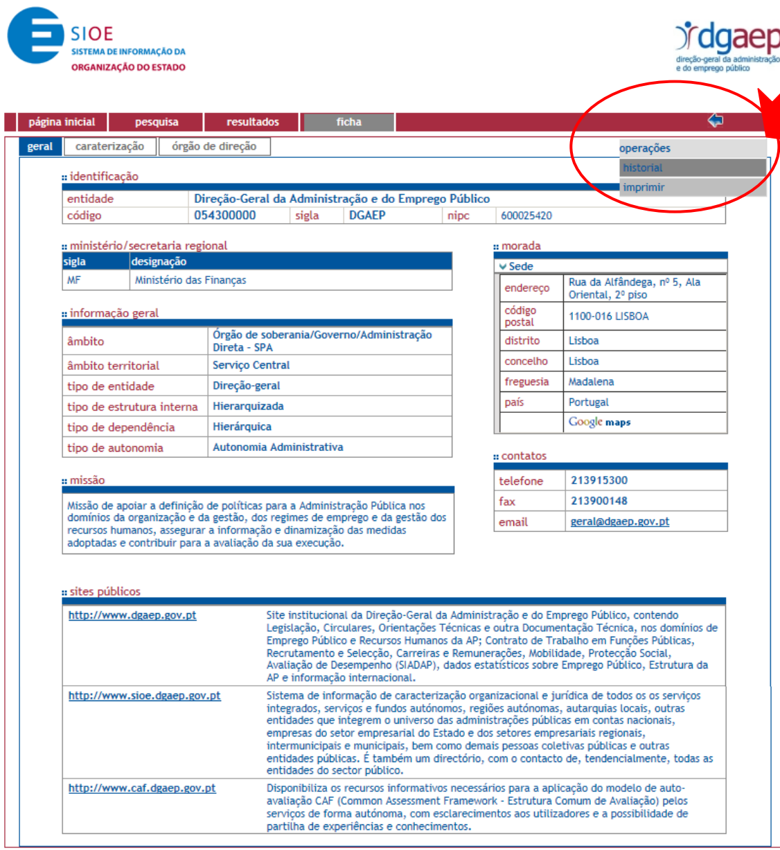
Figura 13 – Menu “operações”

Em todos os separadores é apresentado no canto superior direito o menu “operações” (Figura 13). Neste menu existem as opções “historial” e “imprimir”. O resultado corresponde somente à informação (atual ou histórico) da entidade ou sub-entidade selecionada (Figura 14).