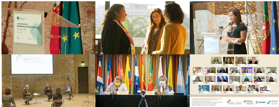
IMAGEM DO MÊS