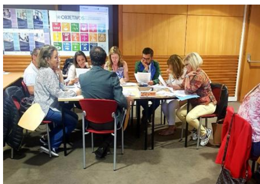
Protótipo da ideia "Motivação 4.0" elaborado pelo grupo de trabalho.