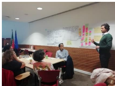
Protótipo da ideia "A Tocha" elaborado pelo grupo de trabalho